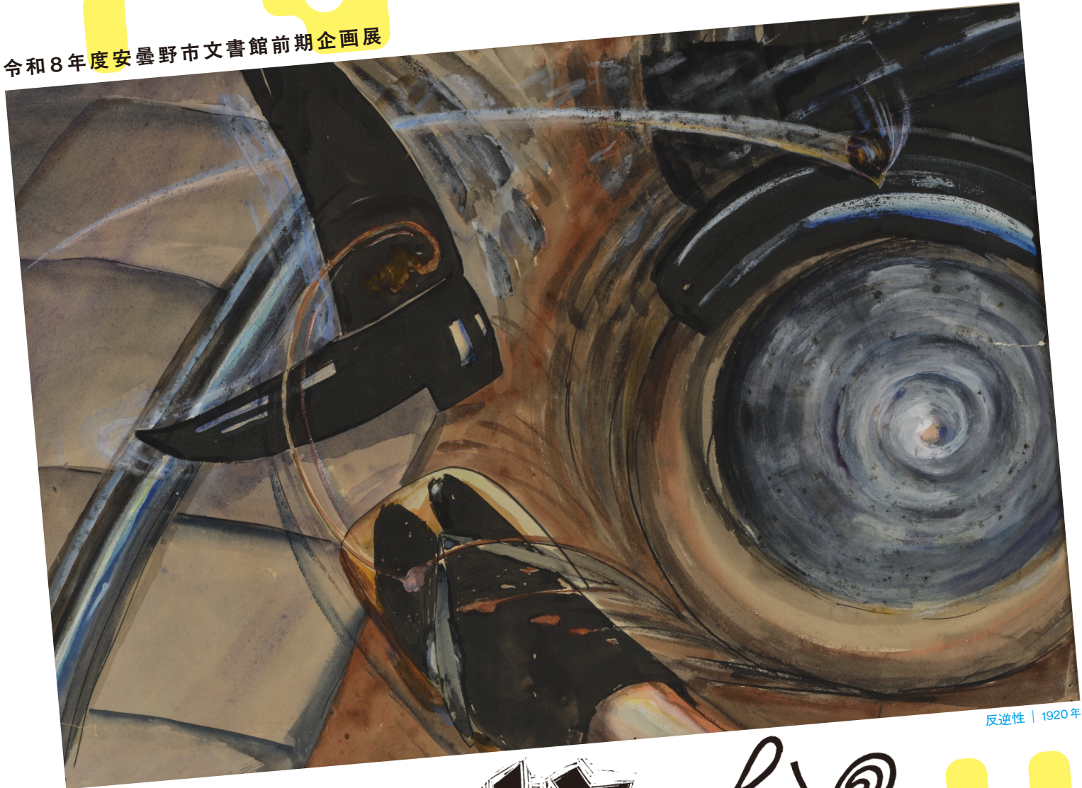
反逆性 | 1920年