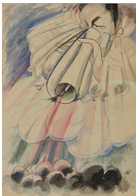
遠めがね | 1920年