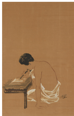
ある日の大杉 | 1920年