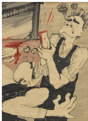
機械は大丈夫か | 1920年