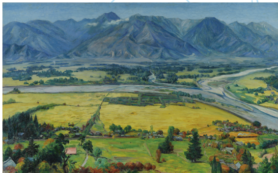
稔りの秋 | 1940年