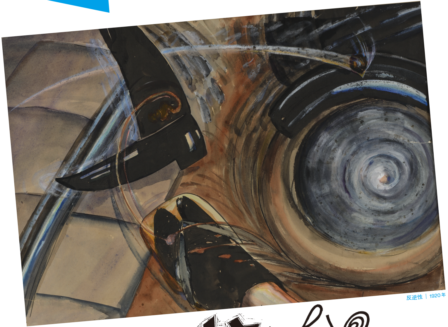
反逆性 | 1920年